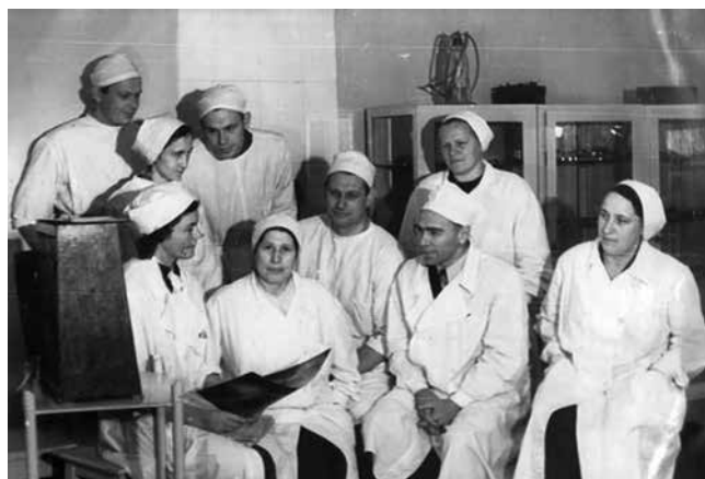
Рис. 4. Фотография с академиком Б. А. Королёвым после первой операции на лёгких в тубдиспансере