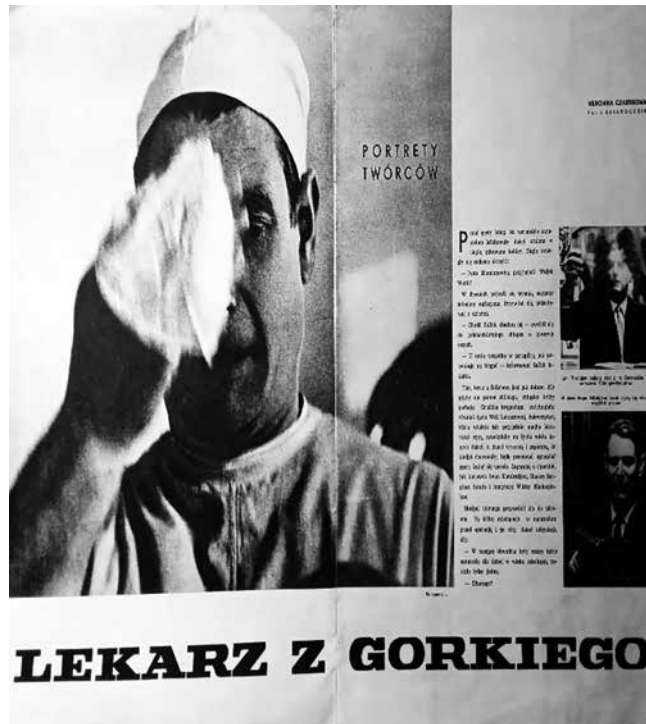
Рис. 8. Статья о И. С. Николаеве в польском еженедельнике Kraj Rad (1966 г.).

Заслуги И. С. Николаева отмечали и иностранные коллеги, его труды опубликованы в разных медицинских журналах и газетах (рис. 8).